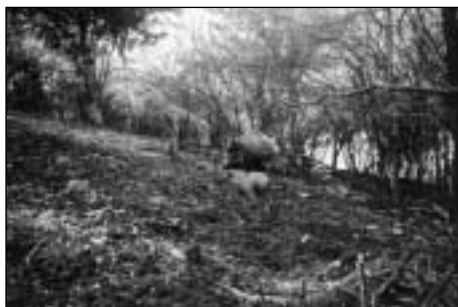
Práca psov v oplôtku.