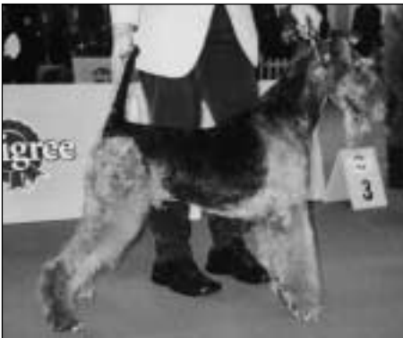
Pes Ch. Greenfield's MAJOR TOM