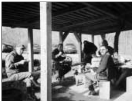
Malé občerstvenie po ťažkom dni dobre padlo.