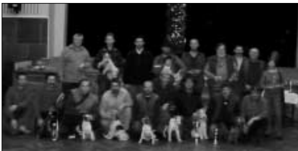
Účastníci KDS 2003

Dňa 28.11.2003 sme sa zišli na III. ročníku Klubových duričských skúškach v Gemerskej Hôrke na ubytovni Hôrka a v náprotivnom kultúrnom dome vo večerných hodinách prebehla prezentácia a losovanie štartovných čísel pre sobotné a nedeľné zápolenie. Skúšok sa zúčastnilo 13 vodičov. Klubovým víťazom sa stal pes hrubosrstý foxteriér Adidas Aktion Aka Slovakia s vodičom i majiteľom