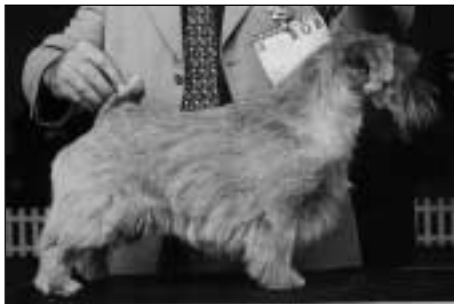
Norfolk teriér, MY SURPRISING AGASSI, BOB.