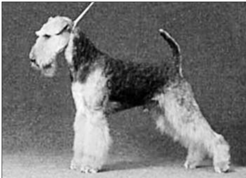
Ch.Matrasen CASH IN HAND