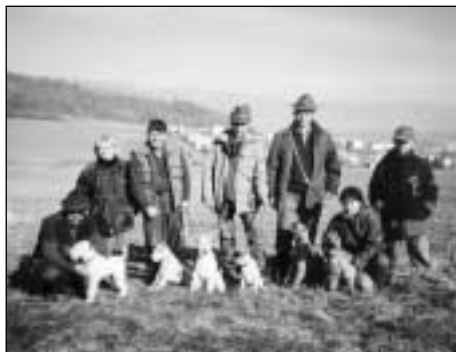
Účastníci výcvikových dní.

kokrát vchádzali do nory v snahe zatlačiť škodnú do tretieho kotla, príp. sa ju pokúsili otočiť a vyhnať, čo sa na skúškach hodnotí vyššími známami, a boli takí, ktorí sa pokúsili aj o chvaty. Nie nardarmo sa hovorí, že škodná je 50% úspechu a preto niektorí mladí jedinci bez problémov dokázali škodú popreháňať po brlohu, kým aj ostrieľaní brlohári niekedy s problémami otáčali škodnú v kotli, alebo ju len dokázali do tretieho kotla zatlačiť a tam ju po celú dobu hlásili. Brlohovačky psikov poriadne unavili, preto si poobede zaslúžili odpočinok v tóni okolitých stromov.