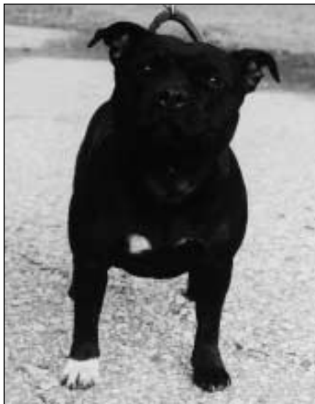
Staffordshírsky bullteriér, HIGH EMOTION DAFFODIL YELLOW, CAJC, Európsky víťaz mladých 2003