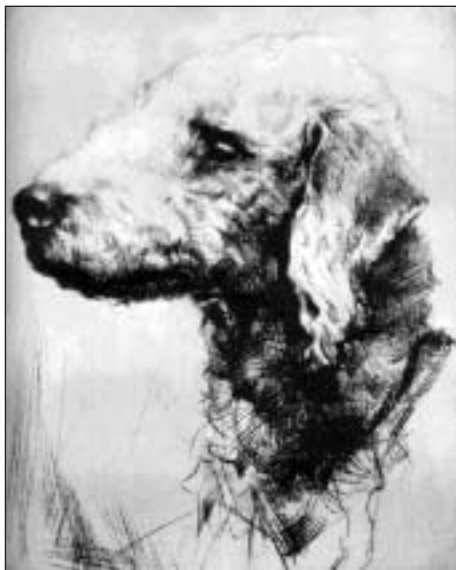
Pôvodný typ hlavy.