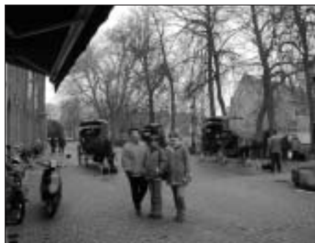
Návšteva malebného belgického mesta Bruggy.