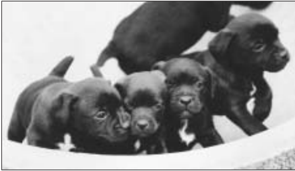
Šestýždňové šteniatka patterdale teriérov.

ničky Patterdale v oblasti zvané Cumbria. V této oblasti, známé svými vysokými a těžko přístupnými kopci s velkým výskytem lišek, jsou tyto nazývány nikoliv "hills", ale "fells", a proto je plemeno někdy označováno též jako fell terrier nebo mnohdy zcela jednoduše, zejména v Americe, jako "Malý černý pes z Anglie" (The Little Black Dog From England). Ve stručném popisu plemene se uvádí, že bylo vyšlechtěno především za účelem norování, tedy již v dávné minulosti jako plemeno norníka, jehož živlem je práce pod zemí, a to i v nejsložitějších podmínkách (např. skalní nory), a které je schopno zdolat v noře predátory o hmotnosti tři až čtyřikrát vyšší než je samo. Takže dnes lze patterdale teriéra nazvat opravdovým pracovním loveckým plemenem se všemi pozitivními atributy, majícího - jak v Anglii říkají - "srdce lva" (heart of a lion).