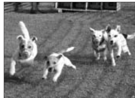
Dostihy teriérovi – finále.

Festival je dvojdňový – prvý deň je zábavný a informačný, druhý deň sa koná výstava. Akcia je „nadklubová“ - russell teriérovi totiž zastrešujú najrôznejšie kluby, či už zastrešené FCI, úplne nezávislé alebo zastrešené inými organizáciami. Účelom russell festivalu je aspoň na jeden víkend v roku „spriatelit“ všetky tieto tábory. Na výstavu je ako rozhodca spravidla pozvaný dlhoročný chovateľ russell teriérovi, z Anglicka alebo USA. Väčšinou to býva človek, ktorý so svojimi psami tiež aktívne pracuje a teda dobre vie, čo je pre pracovného psa dôležité. Tento rok bol pozvaný