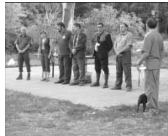
Rozhodcovský zbor pri odovzdávaní cien.

BDT v prvej cene bolo 7 psíkov, v druhej cene 7 psíkov, v tretej cene 3 psy a neobstáli 3 psy.