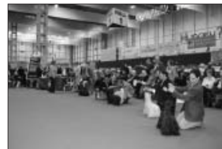
Posudzovanie skye teriérov