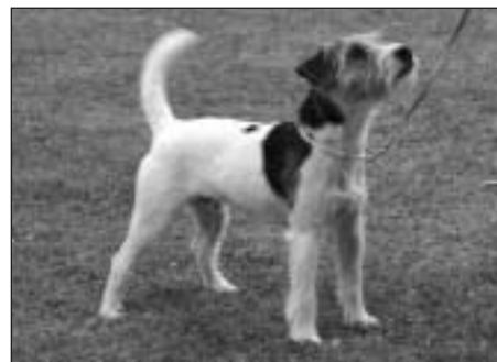
Jack Attack's Vamous Vance – naj. pes nad 30,5 cm.

V nedeľu ráno sa začala výstava. Bolo možné dohľásiť sa ešte na mieste, tak usporiadatelia mali plné ruky práce. Všetko ale zvládli naozaj na jednotku. Veľmi pekná bola tiež dekorácia, počas