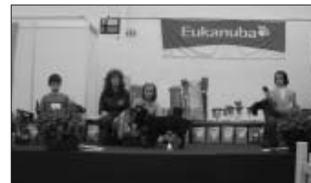
Junior handling I. kategória