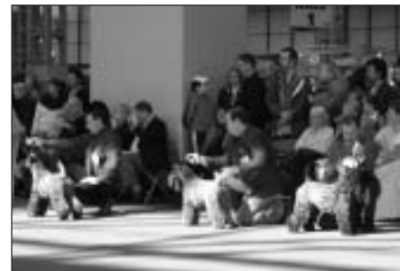
Kerry Blue Terrier - v strede suka zo slovenského chovu Kerrydom Cour Dhaulagiri.

P. S.: K výsledkom z Cruft's 2004 sa dostanete z klubovej webstránky: www.terriers.sk