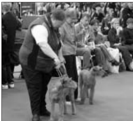
Handleri – dôchodcovia.