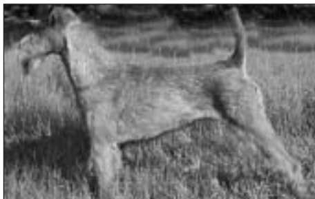
CH AFRODITA Z ÚPLAZU, maj.: manželka Uhlíkovi