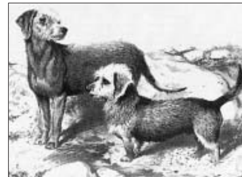
Predkovia dnešného bedlington teriéra.

Kto by sa pri pohľade na jemnú ovečku domnieval, ako sa dnes bedlington teriér javí (tým ale nie je), že toto plemeno patrilo kedysi k najhúževnatejším medzi všetkými plemenami teriérov hraničiacej oblasti medzi Anglickom a Škótskom?