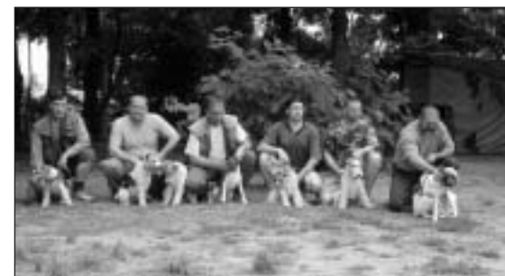
Časť účastníkov so svojimi zverencami.

Na druhý deň sme pokračovali na umelom brlohu. Na výcvik nastúpilo 11 psíkov: 4 hlad-