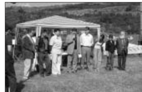
Rozhodcovský zbor a usporiadatelia.

Psy – tr. mladých GUDYORK STEP BY STEP – V1, CAJC, VŠV, BOB XAR GILOGO YOKO VEKDAN – V2 IDEFIX MONASTERY OF LA RABIDA – V3 COUNTRY CLASSIC JORANZA – V4 CASANOVA HYACINT VIOLET FLOWER – V CHARM OF MARYON'S HOME – V CHRISTIAN OF MARYON'S HOME – V JACK DANIEL OF MARYON'S HOME – V ATREI FROM STRONG WINDS VALLEY – VD Psy – tr. stredná CHARLIE MODRÁ LUNA – V1, CC, CAC ARTHUR OF JORANZA – V2, Res.CAC WATERLOO OF NEW DEAL – V3 GIACCOMO OF MARYON'S HOME – V4 URSAM MODRÁ ORCHIDEA – VD Psy – tr. otvorená SHADOW STRÍBRNÉ PŘÁNÍ – V1, CC, CAC ZIGGOR OF MARYON'S HOME – V2