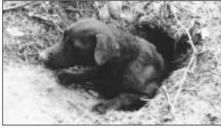
Patterdale teriér pri práci v teréne – v brlohu – Nelinka Srdcové eso.