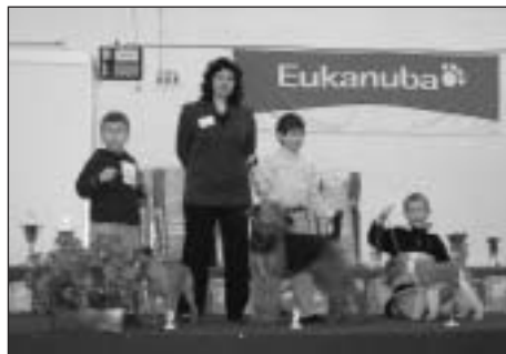
Súťaž Dieťa a pes.