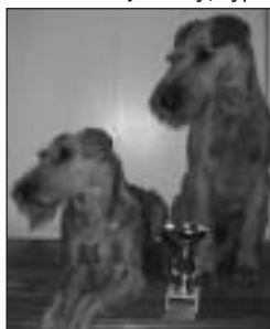
ÍT Sparing Partner Tavari + Afrodita z Úplazu: 3. miesto v súťaži o najkrajší pár.

CORA Z KAVČÍHO HNÍZDA – V Suky – tr. stredná CIRI Z KAVČÍHO HNÍZDA – V, CAC, CC CINDY POCHODĚN – V Suky – tr. otvorená MARION V. IRISH RED – V, CAC, CC, KV, BOB ADDY TERKARK – V DEENA ARIVA – V BÁRA FRANC-FRANC – VD BORA FRANC-FRANC – VD BRITA Z PÍSECKÝCH LESU – VD Suky – tr. šampiónov AFRODITA Z ÚPLAZU – V, CAC, CC ÁGNES Z PŘEROVSKÉ ROKLE – V ALFA TERKARK – VD