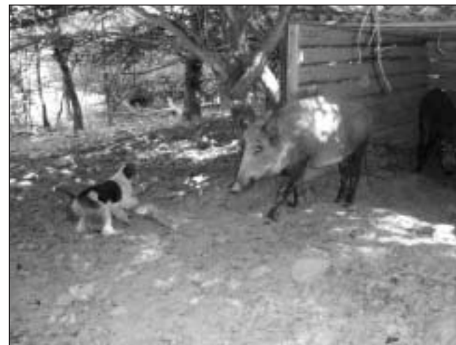
Výcvik mladého foxteriéra hrubosrstého v oplôtku – 6-mesačný Nil z Kuliaru.