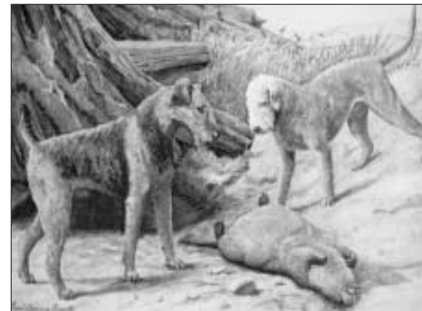
Využitie pri love (z THE NATIONAL GEOGRAPHIC MAGAZINE marec 1919).

vojne sa zdalo, že u nás chov tohoto plemena úplne zanikne. O obnovu sa pokúsili v roku 1957 nadšení kynológovia z Výskumného ústavu lesného hospodárstva v Kostelci nad Černými lesy. Medzi poľovníkmi získalo plemeno veľkú odozvu. Šesťdesiate roky znamenali nečakaný zvrät. Okolo roku 1970 zaznamenal chov bedlingtonov v Československu svoju početnú špičku. Menší záujem o plemeno nie je len českým a slovenským problémom. Tá istá situácia je aj v ostatných európskych štátoch. Bedlingtonov síce nie je veľa, zato sú krásni v exteriéri a vynikajúci