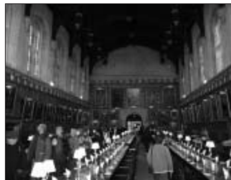
Študentská jedáleň v Oxforde.

Súčasťou výstavy boli aj rozsiahle haly s veľkým množstvom stánkov, kde predávali všetko, čo sa týka psov od kynologickej literatúry, po krmivá, prepravky všetkých druhov, ale aj šperky s motívami rôznych plemien, ktoré sa nám naozaj veľmi páčili. Zaujímavosťou bol aj stánok, kde ste mohli za pomerne nízku cenu kúpiť staršie kynologické časopisy, knihy aj ročenky klubov. Anglické kluby mali v tejto časti svoje propagačné stánky, z ktorých niektoré boli veľmi nápadito upravené. Často tam bolo aj niekoľko jedincov plemena, ktoré klub zastrešuje. V stánku klubu jazvečikov sme videli anglické odchovy jazvečikov, všetkých rázov a druhov srsti. Chovateľov jazvečikov by iste šokovali svojou veľkosťou štandardné jazvečiky, ktoré mali približne veľkosť baseta alebo jazvečikovitého duriča. Angličania si zjavne nerobia starosti s váhou predpísanou štandardom.