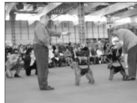
BOB - Welsh teriér A-Speedy Gonzales v.d. Hohen Flur.

s výstavami organizovanými u nás a v okolitých štátoch, na ktoré sme zvyknutí, ale všimli sme si aj mnohé odlišnosti. Kruhy boli veľmi priestrané, po ich obvode boli umiestnené stoličky pre návštevníkov a vystavovateľov. V blízkosti kruhov boli boxy určené pre odkladanie psov, ktoré svojim množstvom stáčili pre všetkých vystavovateľov, takže kruhy obložené klietkami a stolmi na úpravu ste tam vôbec nevideli. Určite, keby ste prezerali katalóg, zmatlo by vás rozdelenie do tried, na ktoré nie sme z výstav FCI zvyknutí, tiež by vás prekvapilo, že jeden pes môže štartovať vo viacerých triedach. Budú vás iste zaujímať počty plemien teriérov, ktoré sa zúčastnili tohoročnej Cruftovej výstavy. Uvediem aspoň niektoré čísla. Napríklad Airedale Terrier 90, Border Terrier 229, Irish Terrier 50, Parson Russell Terrier 117, Staffordshire Bull Terrier 289!, ale napríklad Welsh Terrier len 24, West Highland Terrier 193. Zaujímavosťou je, že yorkširske teriére neboli v tento deň vystavované, pretože v Anglicku patria k trpasličím plemenám, ktoré sa vystavovali iný deň.