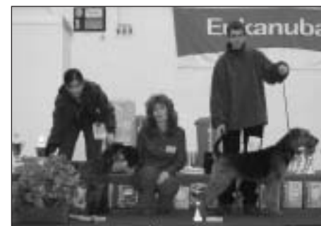
Junior handling II. kategória