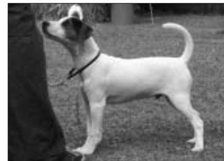
Jackygang's Jungle Joe – 4-mesačný nádejny psík.