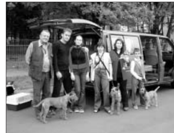
Naša úspešná reprezentácia.