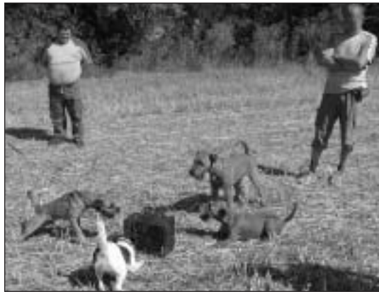
Výcvik disciplíny „odvaha“.

kosrsté foxteriére, 5 hrubosrstých foxteriérov, jeden border a jeden jazvečík. Pri výcviku tejto disciplíny sme sa snažili vytvoriť podmienky aké sú na skúškach v brlohárení. Samozrejme, aj tu boli psiči začiatočníci. Ich majiteľom sme poradili ako pokračovať v ďalšom výcviku názornými ukázkami. Po úspešnom absolvovaní dvoch kôl v brlohu sme ukončili druhý výcvikový deň.