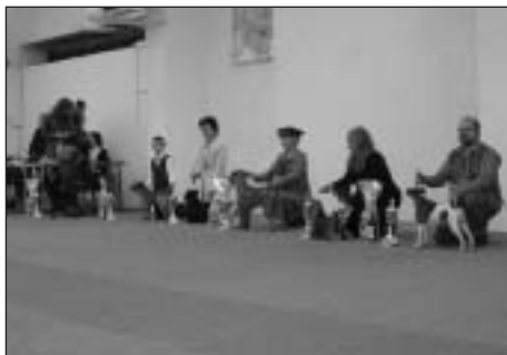
Vyhodnotenie súťaže TOP teriér 2003 exteriér.