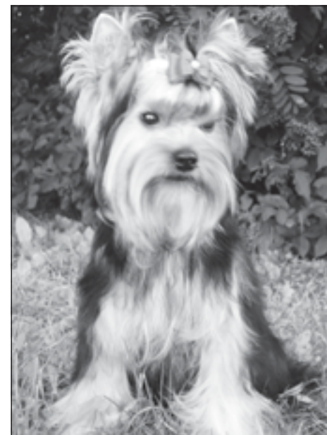
Mladá suka My-DAY Monastery of la Rabida (foto vo veku 6 mes.)