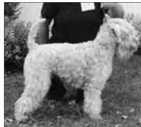
Írsky soft coated wheaten teriér, CH FALKON Soft Kní-York - V1, CAC, CC, KV, BOB, maj.: Knežko-vá Renata

120. Xia od Rytíře Malovce - V1, CAC, CC