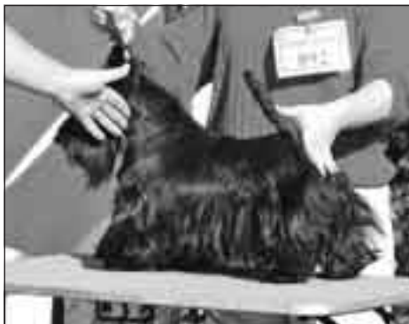
Downtown Ducado, Tata 05

MVDr. Stana Krieková, DRU – WYD Snímky autorka