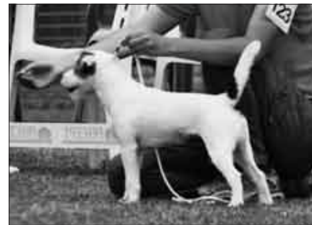
BIS 2005 – Fox Meadow's Adorable Witch