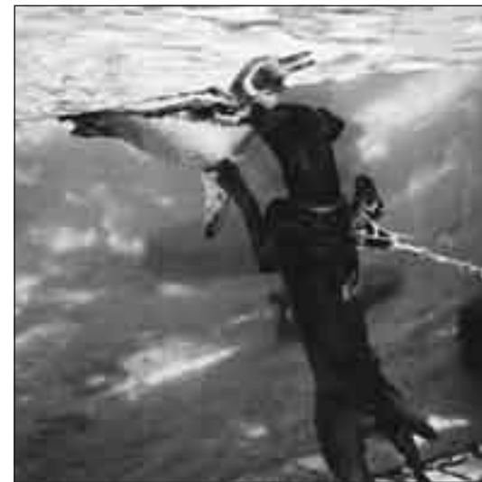
VENDULKA Srdcové Eso (8 měsíců) při hře s tučňákem

Výlet se psem do zoologické zahrady je opravdu příjemným zážitkem a velkým zpestřením života psa. Stal se pravidelnou součástí výchovy mladých jedinců v našem chovu a všichni aktéři se ho účastní s plným nasazením a nadšením. Ideální kombinace pro nás je jeden starší zkušenější pes spolu s adolescentem. Všem vřele doporučujeme!