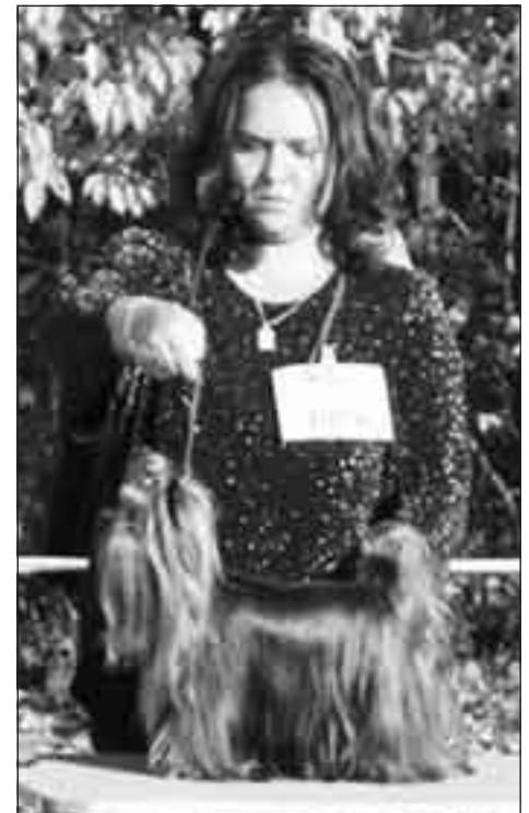
Black Diamond Star of Zaphira's, Tata 05

V nedeľu sme sa už poučili, z domu sme vyrazili o niečo skôr a zvolili sme cestu prevažne po Slovensku. V žiadnom rade sme nečakali, kruh sme našli na prvýkrát, aj spulbojovníci patrili výlučne medzi terierkárov. Rozhodca pán Bojan Matakovič zvolil pri posudzovaní dosť rýchle tempo, a tak ani naša výstavná nervozita netrvala dlho. Ani tento deň sa poradie psov výrazne nezmenilo, čo potvrdilo kvalitu jednotlivých posudzovaných jedincov. Psy: BOB, CACIB – Ramirez Euri-Escot, CAC, res. CACIB – Downtown Ducado, HPJ – Ebesi Angyal Baltazar. Suky- CACIB – Sonet Du Moulin de McMo-