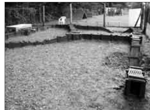
Prostredie umelého brlohu

My sme sa prihlásili na všetky disciplíny.