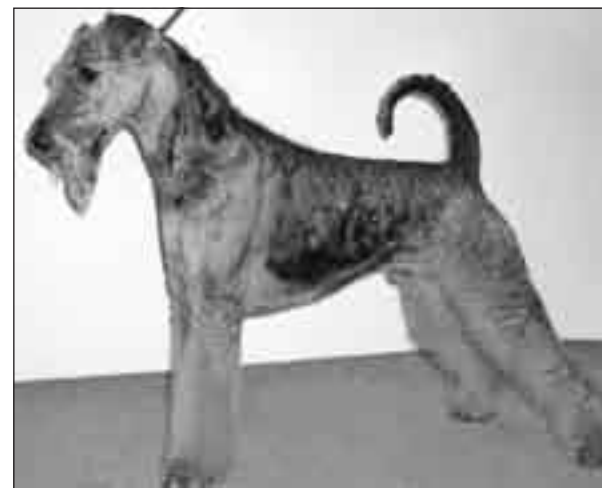
CH. DIDI MADE ANDREE, CAC, INTERRA CHAMPION BOB