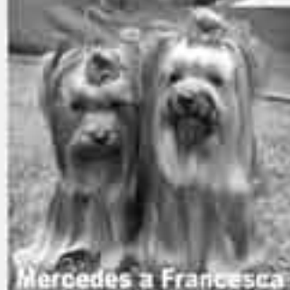
Mercedes a Francesca

Ponúkame krytie s našimi psami za výhodných podmienok.