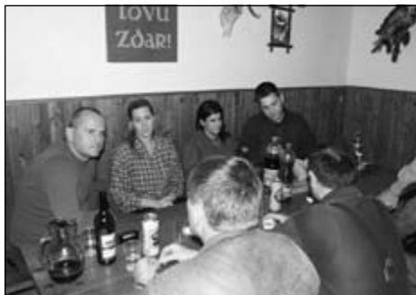
Družná debata a vymieňanie si skúseností medzi súťažiacimi

a strelalo sa i na diviaka. Po ukončení rozhodcovia urobili výber a pokračovalo sa v treťom pohone, kde už bola i diviacia zver a jeden kus diviaka sa i strelil.