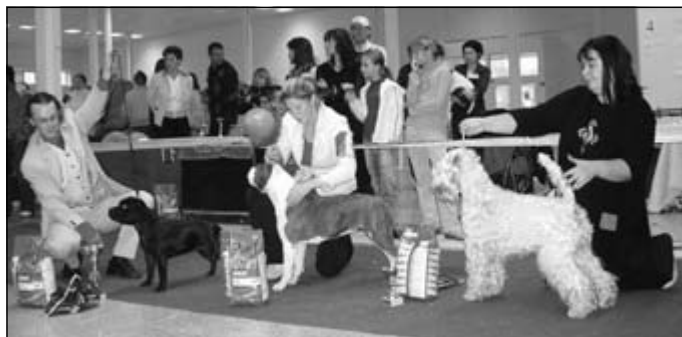
BOG vysokonohé – Stafordšírsky bulteriér, Americký staf. teriér, Írsky soft Coated wheaten teriér.