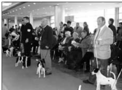
Hladkých foxteriéro- v zastupoval P. Glezgo a FTH Wild World Agria

Účasť na takomto významnom podujatí je určite zaujímavá nielen pre našich vy- stavovateľov, či členov klubu, ale i organizátorov výstav, pretože v roku 2009 Slove- nsko čaká náročná úloha Svetová výstava psov v Bratislave a pre náš klub teriéro- v pravdepodobne aj organizácia Interry. Medzinárodný klub teriéro- v oslovil Slovenský klub