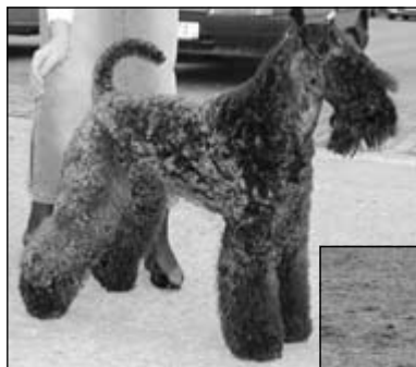
CH SK Bhelliom Extra Guiness, splnené podmienky na ICH.; CAC Eurodog Bratislava 2003, BOB Tata 2006