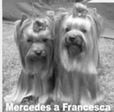
Mercedes a Francesca

Ponúkame krytie s našimi psami za výhodných podmienok.