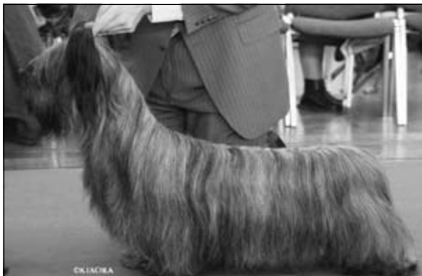
CH. FLANAGAN ZWEET SENSATION - Res.CACIB, Vice Svetový víťaz 2006