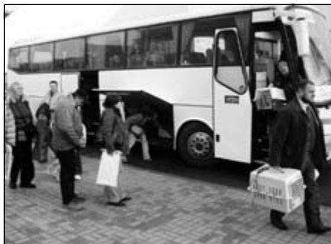
Ranný príchod na výstavisko

Táto veľkolepá výstavná show sa konala v priestore známych poznaňských trhov. Lámal viaceré rekordy. Bolo prihlásených rekordných 21 tisíc psov 354 plemien zo 60 krajov. Medzi inými aj z takých vzdialených častí sveta ako Peru, Venezuela, Kolumbia, Argentína, Japonsko a iné. Treba uznať, že Poliáci náročnú organizáciu výstavy takéhoto rozsahu zvládli na jedničku. Kruhy boli dostatočne veľké, parkovacie priestory nepraskali vo šví-