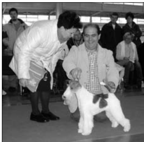
FTD, suka Chelines LA REMUNDIALESKA – V1, CWC/CAC, CACIB, BOB, Svetový víťaz 2006