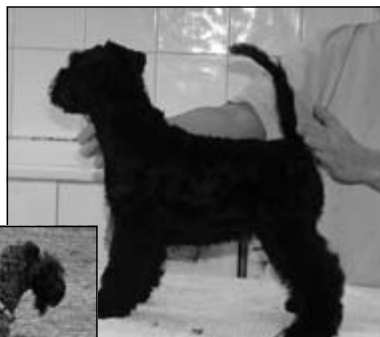
KBT Bhelliom I am pretty