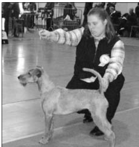
Suka - Baroness v. Baerobaka – V1, CAC