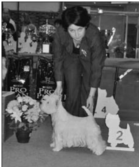
CH. Coconut Sunshine Celebration

V prvej disciplíne sa hodnotí trpezlivosť psa pri manipulácii s ním cudzím človekom. Nejde tu však len o bežné prehmatanie, ale rozhodca so psom robí rôzne pohyby aj vo vzduchu, bez varovania psa otočí na rukách brucho hore a pod. Napriek tomu, že Kimi to zvládla s nonšalantnosťou seba vlastnou bez mihnutia oka, nemyslím, že