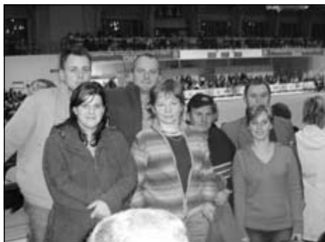
Skupinka účastníkov zájazdu