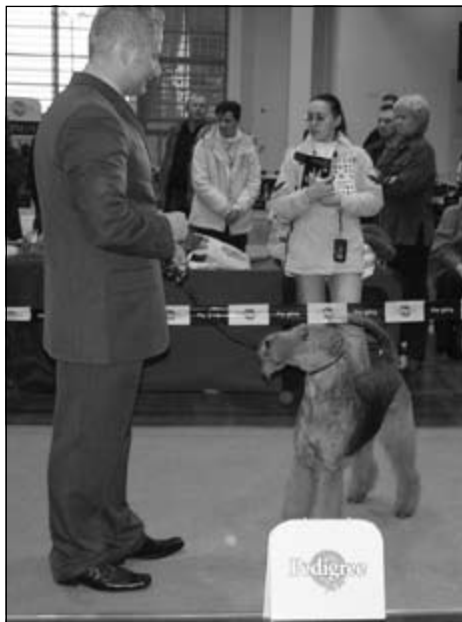
Posudzovanie v kruhu erdelov