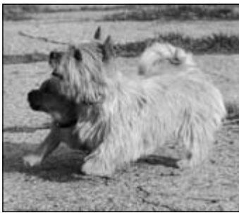
Bhelliom Ariccot Brandy a šteňa Corvette