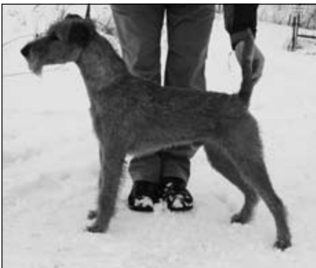
CH Uther Tavari