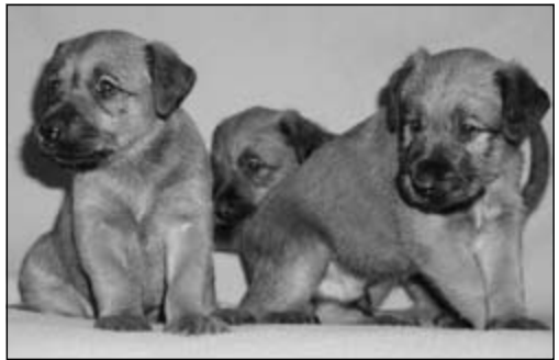
šteniatka írskych teriérov – vrh „Z“