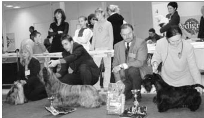
BOG nizkonohé – yorkšírky teriér, skye teriér, škótsky teriér.

Suky – tr. šampiónov – Championklasse MERCEDES OF MARYON'S HOME – V1, CAC, CC