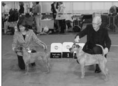
Suka - Majomas Black Magic Woman – V1, CAC, CACIB, Svetový víťaz (vľavo)

nému mladému psovi, ktorý dostal aj titul BOB sa skutočne ťažko dalo niečo vytknúť. Rozhodkyňa bola v posudzovaní dôkladná, dbala na pohyb a nemala problém aj v triede šampiónov zadávať známku veľmi dobrá. Napr. v triede šampiónov psy, ktorá bola najviac obsadená z desiatich nastúpených psov, päť dostalo známku veľmi dobrá.