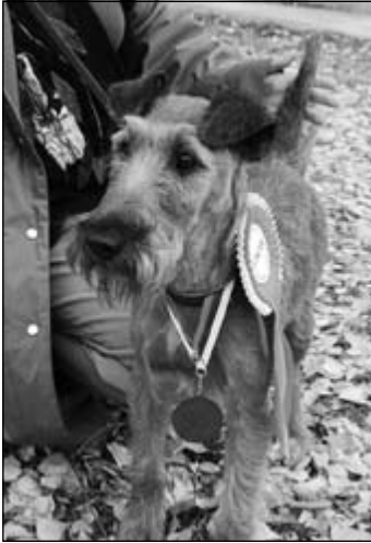
ICH Tina Turner Tavari

Predpoklad výborných pováh, dobrých poľovných vlastností a temperamentu.