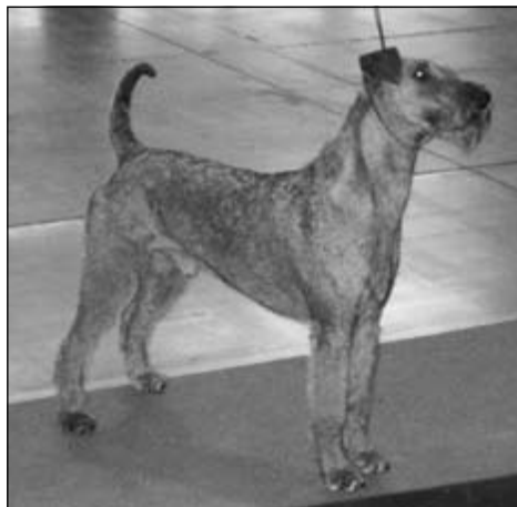
Pes – Merrymac Show Stopper – V1, CAJC, Svetový víťaz mladých 06, BOB