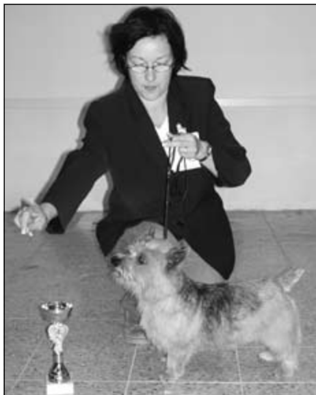
Norwich teriér, pes, RAGUS BLACK TEE – V1, CAC, KV, BOB, maj.: Liane Ruck

BHELLIOM APRICOT BRANDY – V1, CAC, CC KV