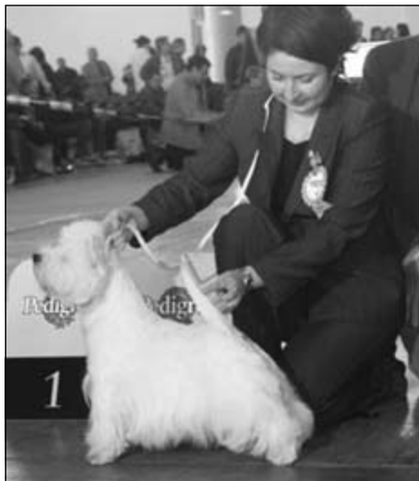
ICH. Touch of Class du Moulin de Mac Gregor - Svetový víťaz 2006, BOB

Ako jedno veľké mínus hodnotím rozmiestnenie jedného plemena do viacerých kruhov, čo je prirodzeným štandardným riešením pri veľkom počte prihlásených psov a súk v jednom plemene, tak ako tomu bolo aj u west highland white teriérov, kto-