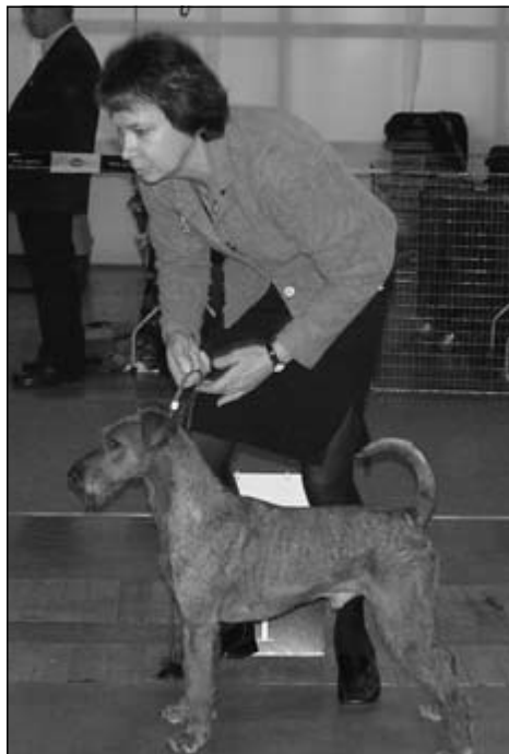
Merrymac Push The Limit – V1, CAC, R.CACIB