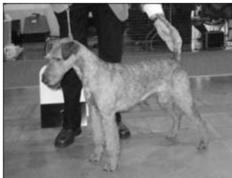
Suka – Kate Bush v. h. Laagveld – V1, Svetový víť. mladých