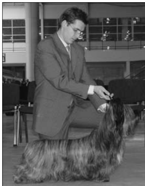
CH. FLANAGAN ZUCCHERINO - Res.CACIB, Vice Svetový víťaz 2006