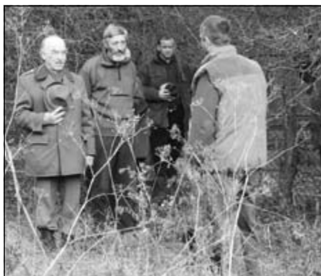
Zahlasovanie sa na disciplínu