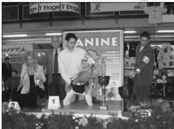
CH. Flanagan Zuccherino - 3. BOG CACIB Orléans

V dňoch 14. a 15.10.2006 sa konali vo francúzskom meste Orléans, cca 1 400 km od Bratislavy dve zaujímavé akcie pre škótske plemená teriérov – west highland white, skye, škótsky, cairn a dandie dinmont. Jednou z nich bola dvojdňová medzinárodná výstava, ktorá bola zároveň špeciálnou výstavou pre škótske plemená teriérov. Druhou bola jedna z dvoch najvýznamnejších výstav pre tieto škótske plemená teriérov (a jedna