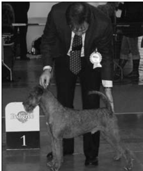
Merrymac Living Legend – V1, CAC, CACIB, Svetový vítěz