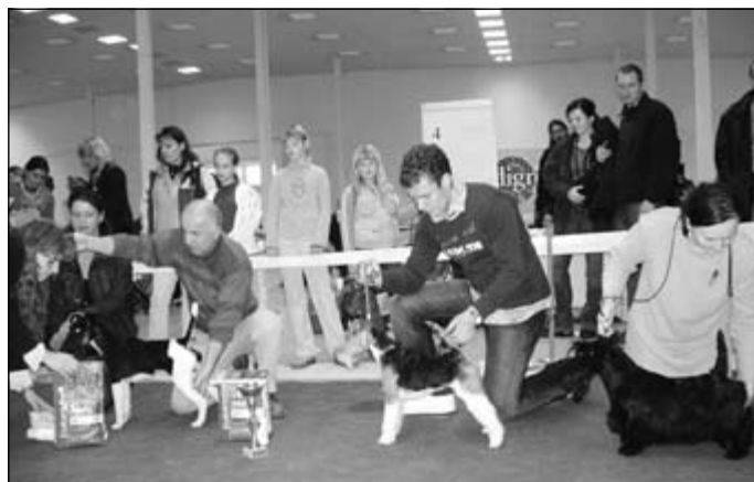
O junior BIS-a.