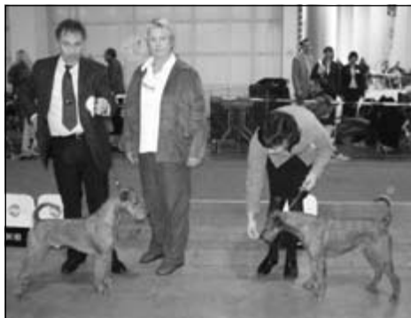
o CAC, Ba