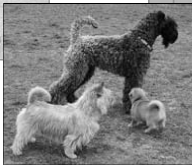
Včasná socializácia KBT Bhelliom Extra Guinness a norwich Bhelliom Apricot Brandy