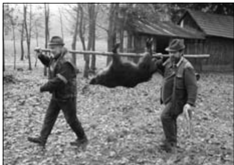
... už ho vezú... úlovok z pohonu