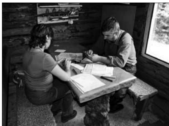
Rozhodcovia pri spracovávaní výsledkov