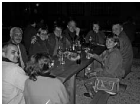
Večerná, priam medzinárodná rozprava. Bez dobrej nálady sa to neobišlo