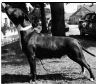
BEAUTY NIKITA STAFF KOMAS