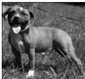
BLOCKBASTER BEAUTIFUL NUGGET L2-HGA / HC – clear