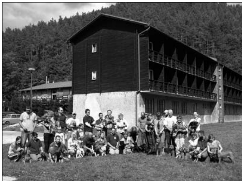
Časť účastníkov výcvikových dní