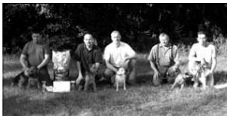
Skupina účastníkov z Poľska