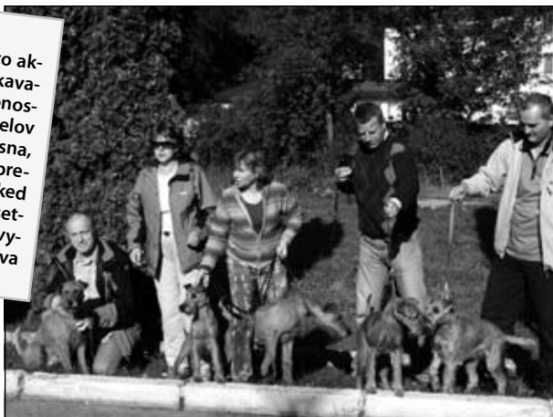
Skupina írčanov so svojimi majiteľmi