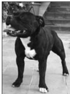
JCH. BART STAFF KOMAS L2-HGA – clear