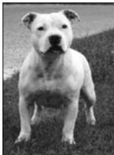
CH. ALTHIA STAFF L2-HGA – clear