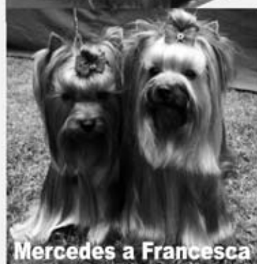
Mercedes a Francesca

Ponúkame krytie s našimi psami za výhodných podmienok.