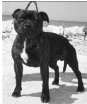
SBT JCH Robie the Bruce Fransimo Bohemia

Ako dobre vieme, výstava Crufts je legendou a jednou z najprestížnejších výstav v Európe. Možno i na svete. Velmi ťažko