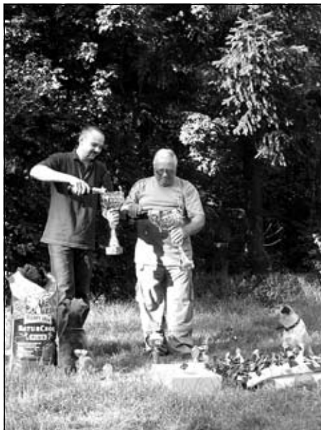
Obaja víťazi si po skúškach dopriali pohár víťazného, perlivého moku ...