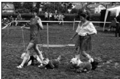
WHWT v akcii „na zelenom móle“