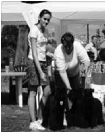
Najkrajšia skupina: KBT