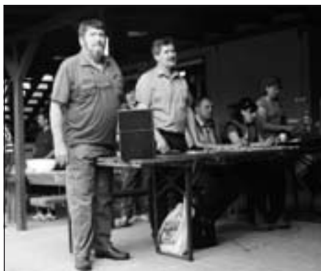
Príhovor hlavného rozhodcu p. Švédú.