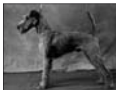
Sparing Partner Tavari

Dina bola skvelá sučka s výborným charakterom. Bola to ozajstná psia „dáma“, zachováva júca si vždy svoju dôstojnosť. Natrvalo si získala naše srdcia i srdce našich priateľov a známych.. Jej najúspešnejší potomkovia, ktorí odovzdávajú svoje kvality ďalším potomkom sú: