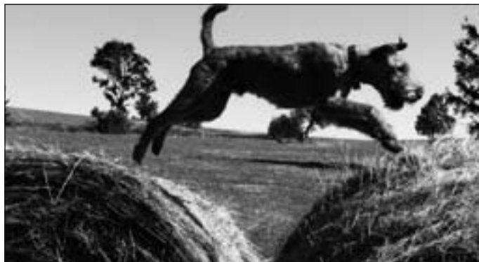
Zdolávanie prekážok alebo „let írčana“.

piškóta a rožok. Ove- renie odpovedí absol- voval každý so svojim psom, čo bolo mimo- riadne zábavné. Až na jedného si to pes uro- bil podľa seba a nie podľa toho, ako by si to predstavoval jeho majiteľ. Vrcholom ve- čera bolo vyhodnote- nie testu a to hlavne „zaručene správnych“ odpovedí.