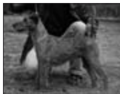
CH Uelis Tavari