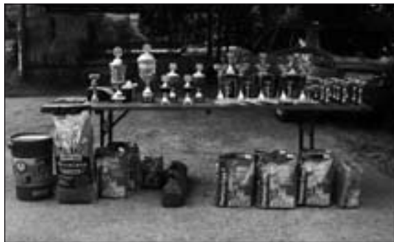
Ceny pre víťazov.