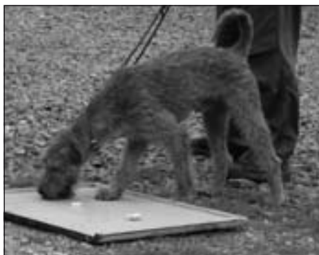
Skúška pamlskov: „prvý padne na obeť salámik a potom aj to ostatné...“