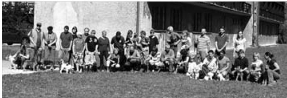
Účastníci výcvikových dní.