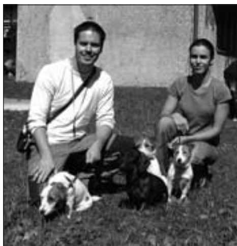
Jack Russel teréry a hrubosrstý jazvečík.