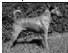
CH Terrence Tavari, SD III.c., FS, LS I.c.