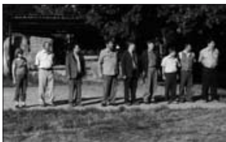
Zahájenie súťaže – rozhodcovia a prípravný výbor.