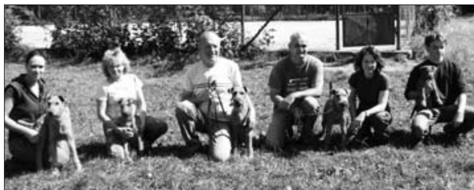
Skupina majiteľov írskych teriérov.