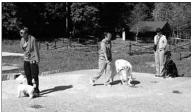
Cvičenie povelov „sadni“ a „zostaň“.