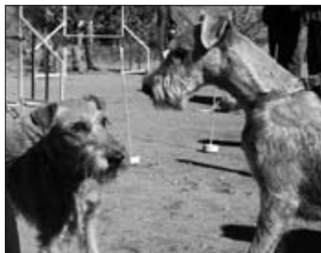
Kto bude pri agility šikovnejší?