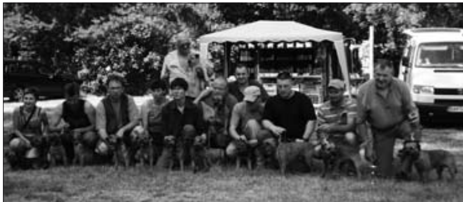
Najpočetnejšie plemeno zastúpené na súťaži a MFS: border teriér.