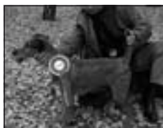
ICH Tina Turner Tavari, KFST I.c.