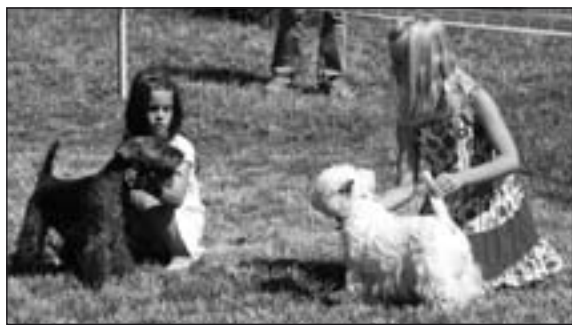
Dieťa a pes