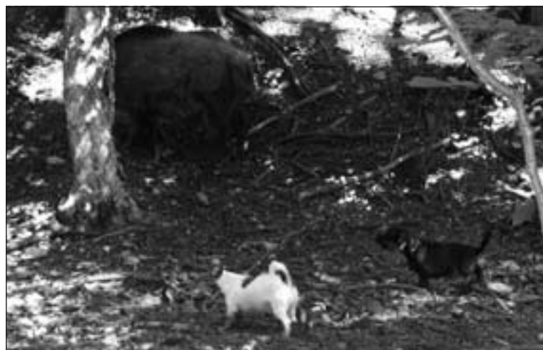
Diviaka sa nezľakli ani JRT a jazvečík.