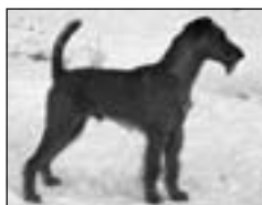
ICH Uther Tavari, KDS III.c.

Multišampión, ICH, Európsky víťaz, KFST II.c.