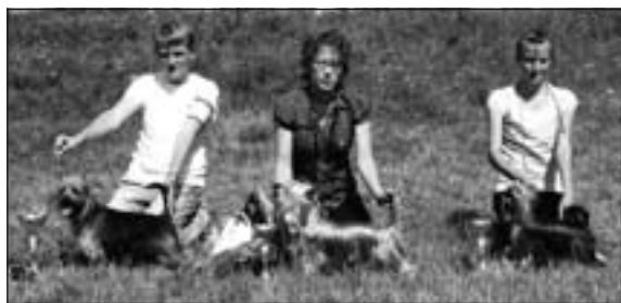
Junior handling II.