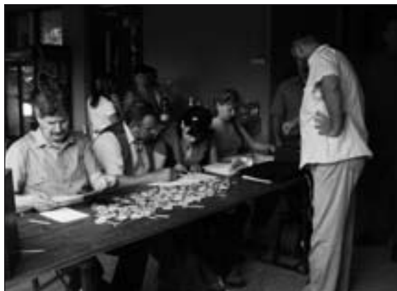
Kontrola rodokmeňov a losovanie štartovacích čísel.