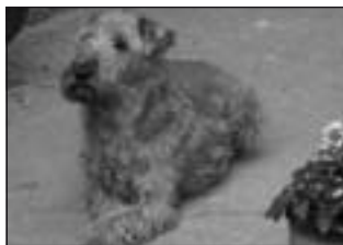
Dina vo veku 12 rokov

Dina bola skvelá sučka s výborným charakterom. Bola to ozajstná psia „dáma“, zachováva júca si vždy svoju dôstojnosť. Natrvalo si získala naše srdcia i srdce našich priateľov a známych.. Jej najúspešnejší potomkovia, ktorí odovzdávajú svoje kvality ďalším potomkom sú: