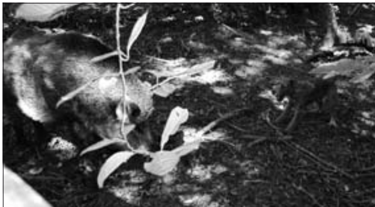
Írčan v akcii pri diviakovi.