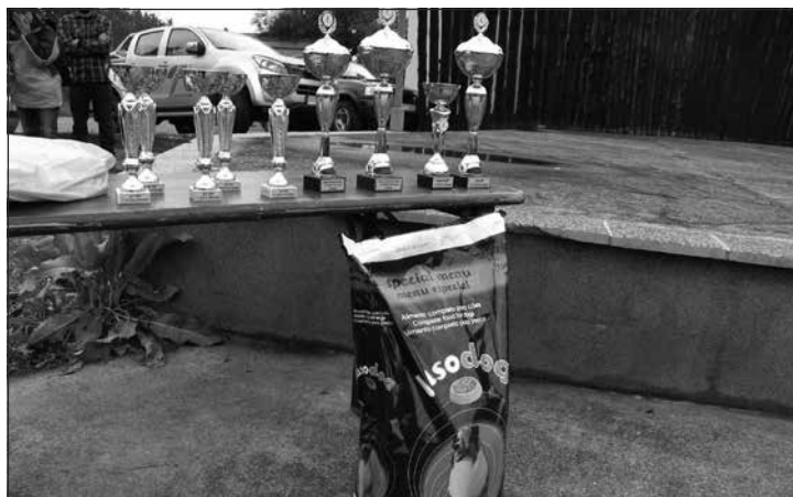
Ceny pre víťazov