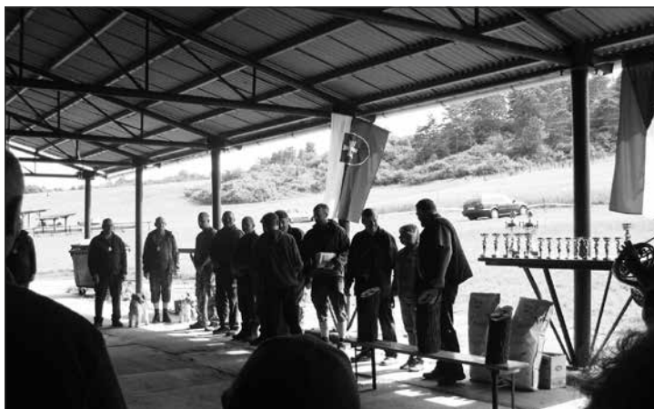
Preberanie víťaznej ceny