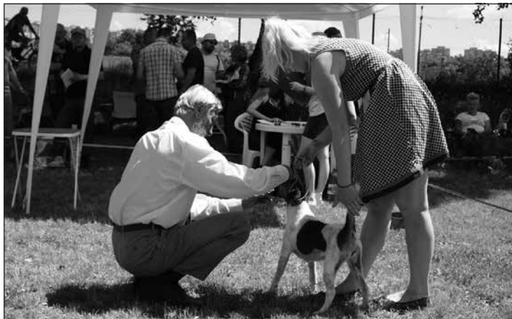
Posudzovanie plemena foxteriér hladkosrstý, rozhodca: MVDr. S. Bučko