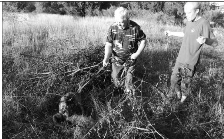
Výcvik disciplíny „dohľadávka“