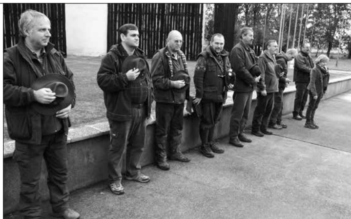
Rozhodcovia a usporiadatelia