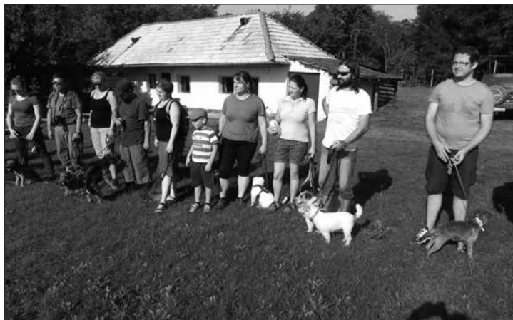
Účastníci Víkendu s teriérom 2015