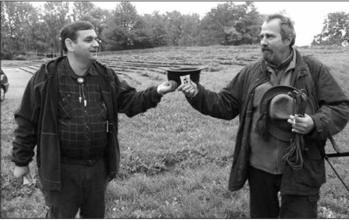
Losovanie štartovných čísiel