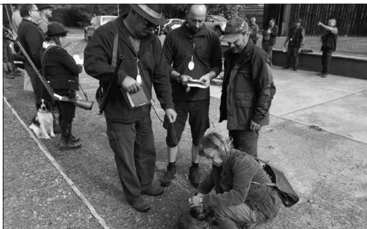
Kontrola tetovacích čísel