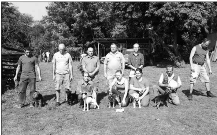
Absolventi úspešného výcviku