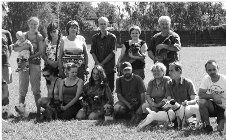
Účastníci Víkendu s teriérom 2015