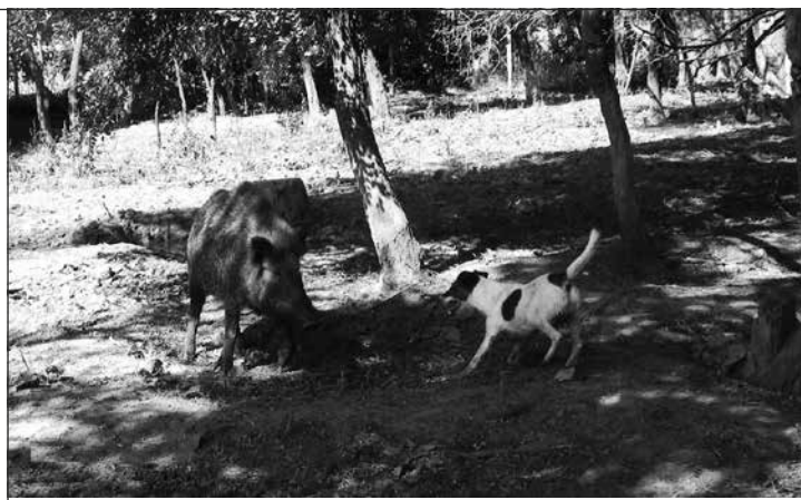
„Zoči voči“ ... práca v oplôtku