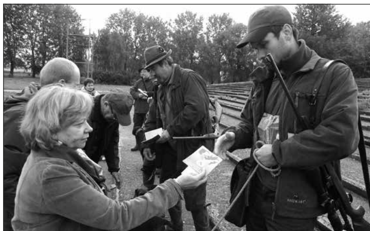
Kontrola psíkov a tetovania