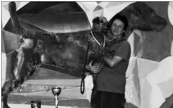
Medailisti kategórie Large