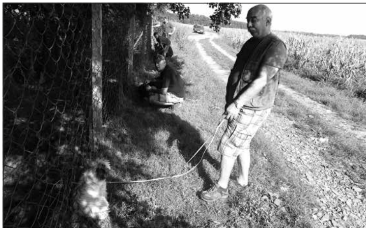
Pri oplôtku... „no a za chvíľu sme tam...“