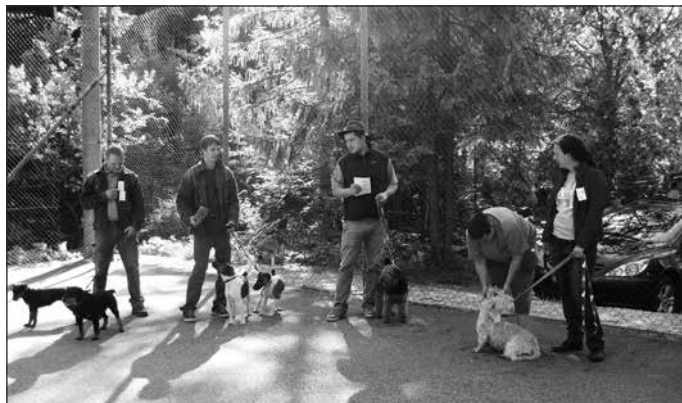
Spokojnosť s vylosovaným poradím?