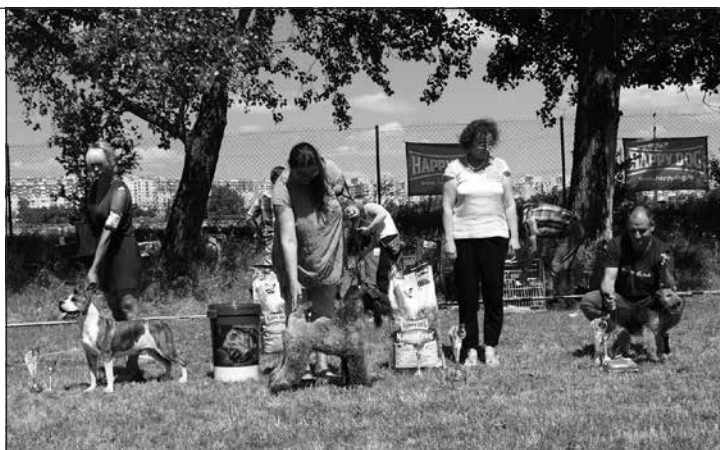
BOG vysokonohé: KBT – DINNYÉSVÁROSI NIRVAN, rozhodca: Z. Szövényiová