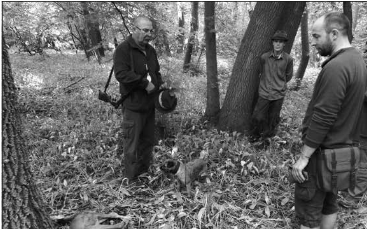
Úspešné ukončenie disciplíny