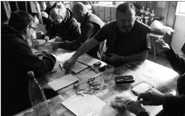
Spracovanie výsledkov skúšok