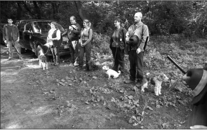
Pred disciplínou v lese