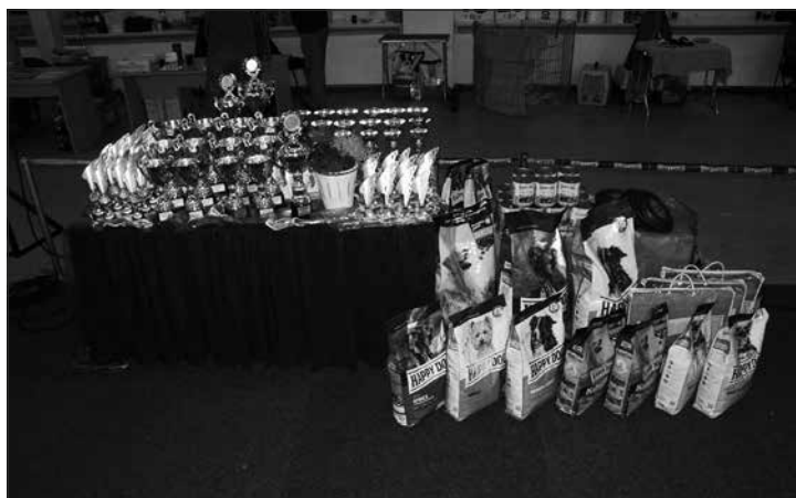
Ceny pre víťazov

SKYGLOWS HUGE LOVE – VN1 ONLY CRAZY OD BENGA – N2 Suky – tr. mladých / Female – Junior Class SKYGLOWS GRATEFUL FOR LOVE – V1, CAJC, KVM, BOS TIFFANY LONG STEP – V2 PRETTY CINDY CRAWFORD CANOSSA – VD3 ANGEL SUNSHINE STAFFY – VD4 FACE TO FACE FER-STAFF – VD MELODY TIANN – D Suky – tr. stredná / Female – Intermediate Class RINGMASTER BELLEFIRE – V1, CAC, CC, KV TANYA'S LIFE LADY Z KATU – V2, Res.CAC KARBALLIDO STAFFS KAMELO-FLIGHT – V3 CALIFORNIAN DREAM THE KINGS OF OLDHILL – V4 BEATHAG STRONG BLUE POWER – VD MELODY BAKERO – D Suky – tr. otvorená / Female – Open Class EMPRESS FROM FER-STAFF – V1, CAC, CC