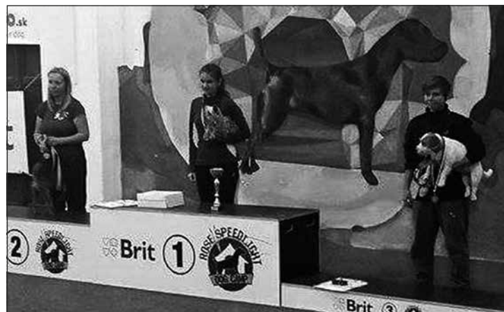
Medailisti kategórie Small