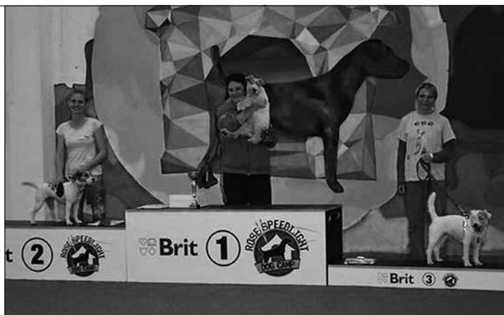
Medailisti kategórie Medium