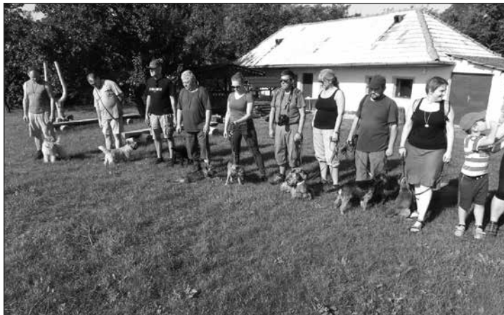
Účastníci Víkendu s teriérom 2015