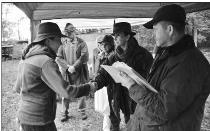
Gratulácia nežnejšej časti víťaznej trojice