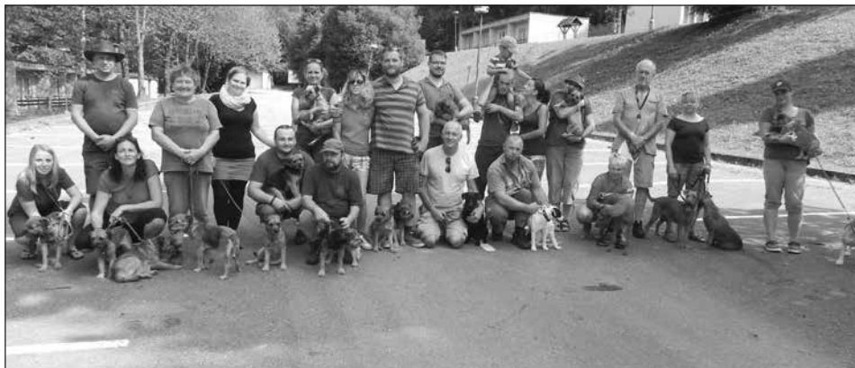
Účastníci výcvikových dní 2017