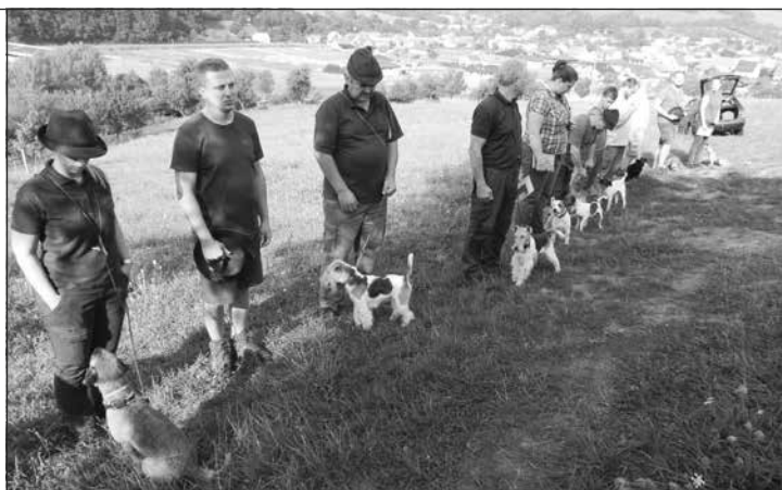
Nástup účastníkov na výcvikové disciplíny