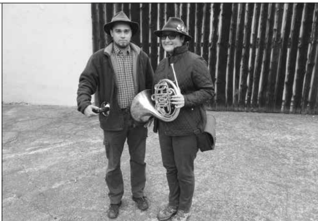
Zahájenie skúšok tradične s trubačmi