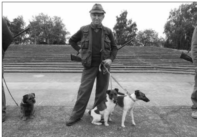
Riadne ustrojený vodič so svojimi zverencami