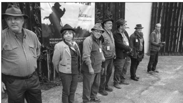
Rozhodcovia, usporiadatelia a zástupcovia SKCHTaF