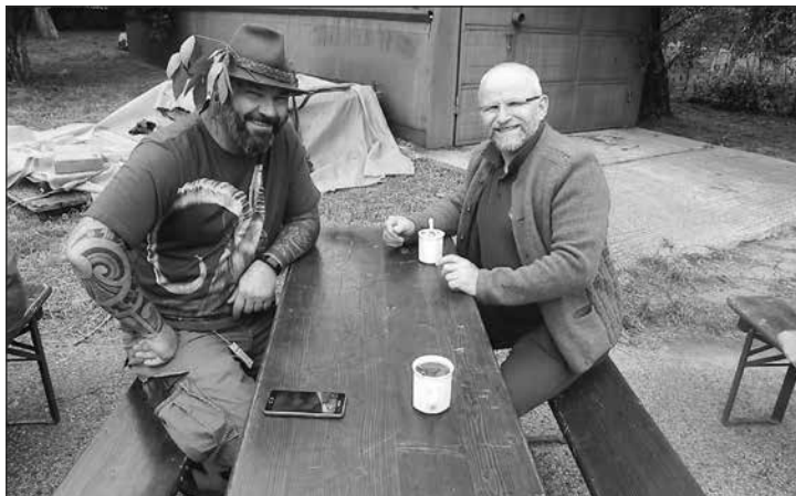
... a vytúžená kávačka