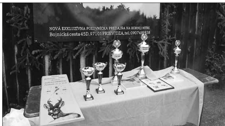
Ceny pre víťazov