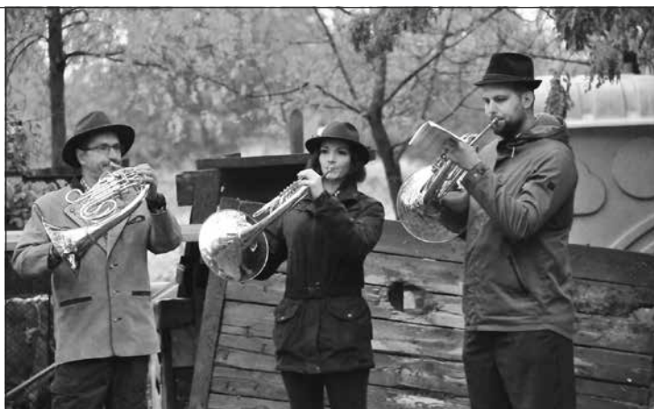
Skúšky slávnostne otvorili zvuky trubačov