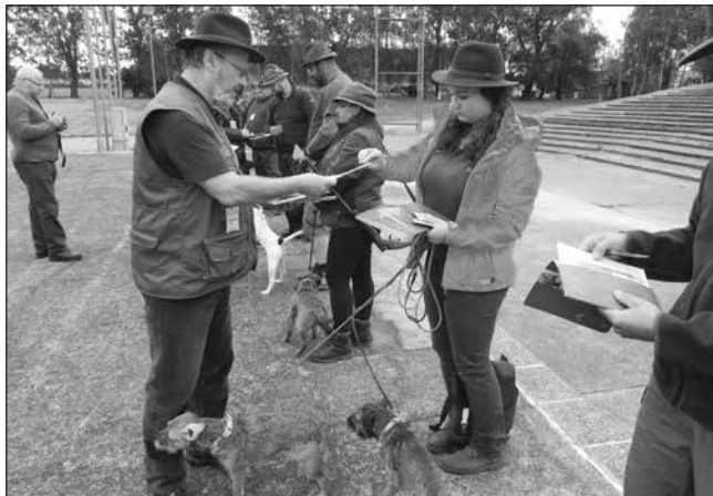
Kontrola preukazov pôvodu a tetovacieho čísla