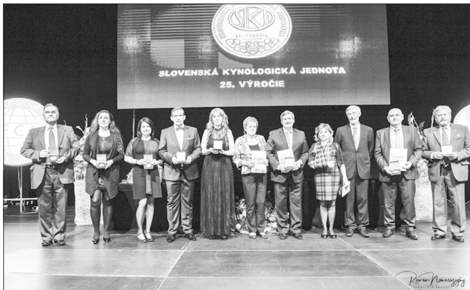
Ocenení členovia SKCHTaF

Všetkým odmeneným a vyznamenaným gratulujem a prajem veľa optimizmu a chuti do ďalšieho kynologického života.