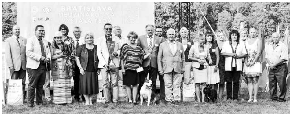
JBIS & BIS Bratislava