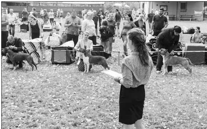
Posudzovanie v kruhu AST