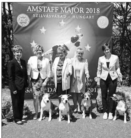
BIS Breeding group