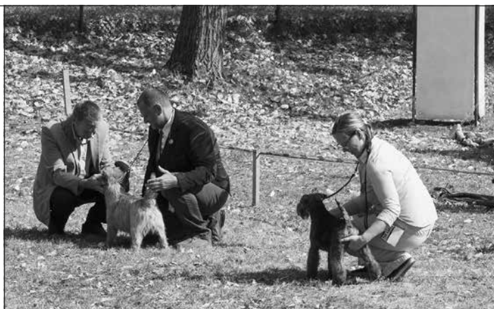
F. Polehňa – rozhodovanie o BISa