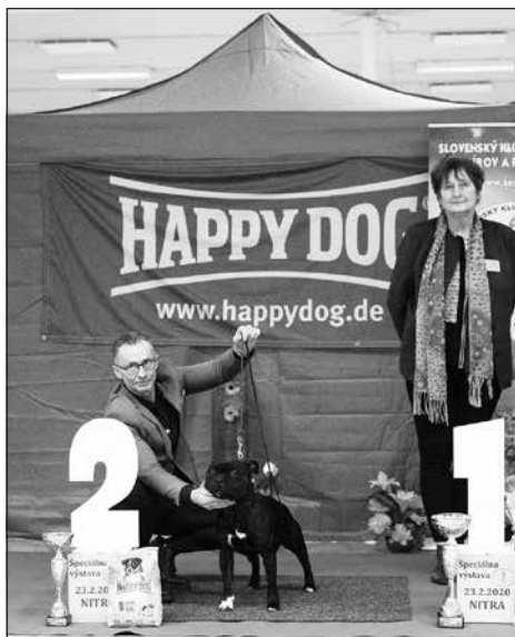
Najkrajší mladý pes 2. miesto: BRUTUS EL DIABLO WINNERSTAFF, Staffordšírsky bullteriér, maj.: Nagy Alexander