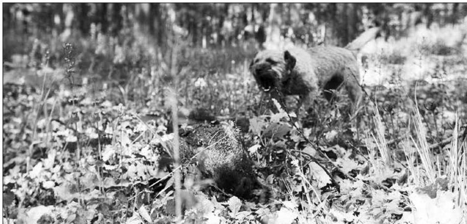
Vítěz BDT Bailey na disciplíne pri diviakov