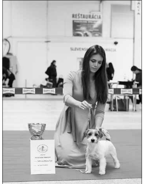
TOP JRT 2019 Fall In Love Bohemian Touch, suka, maj.: Z. Pravotíková