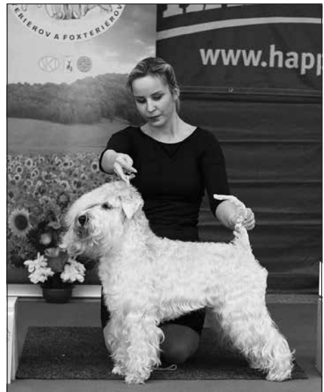
TOP zahraničie: ISCWTF Flare Kní-york z Tržišťe, suka, maj.: Mgr. P. Šubertová