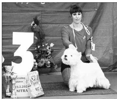
BOG nízkonohé 3. miesto: JIMMY GIVE ME FIVE WHITE CRYSTAL GI&GI, West highland white teriér, maj.: Harangozó Ágnes