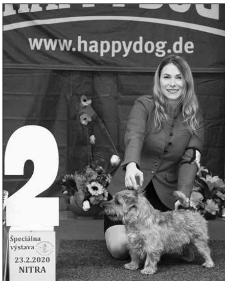
TOP teriér 2. miesto: Norfolk teriér Tweedledee Teddy As Humble Gatsby, pes, maj.: Z. Konštiaková