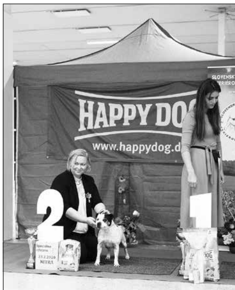
Najkrajší čestný 2. miesto: BULL FOR YOU TOP BANANA, Staffordšírsky bullteriér, maj.: Prokopová Petra