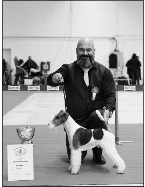
TOP Foxteriér hrubosrstý 2019 Izak Rogohox, pes, maj.: O. Poór