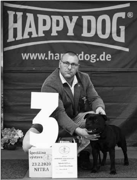
TOP teriér 3. miesto: SBT Brembo Acheron Slovakia, pes, maj.: R. Odnechta