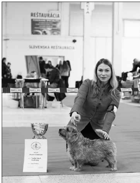
TOP Norfolk teriér 2019 Tweedledee Tedy As Humble Gatsby, pes, maj.: Z. Konštiaková