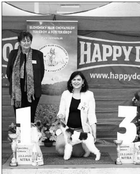
Najkrajší mladý pes 1. miesto: GABRIEL Z ELGARDU, Foxteriér hrubosrstý, maj.: Duspivová Iva